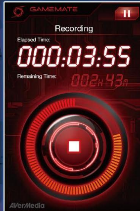
Statut en un Clin d'Oeil