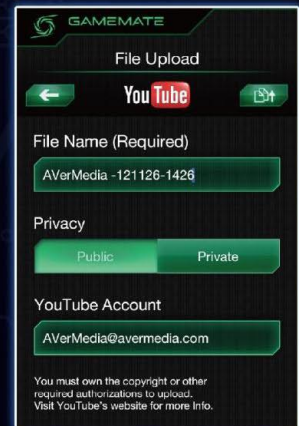
Partage de Gameplays